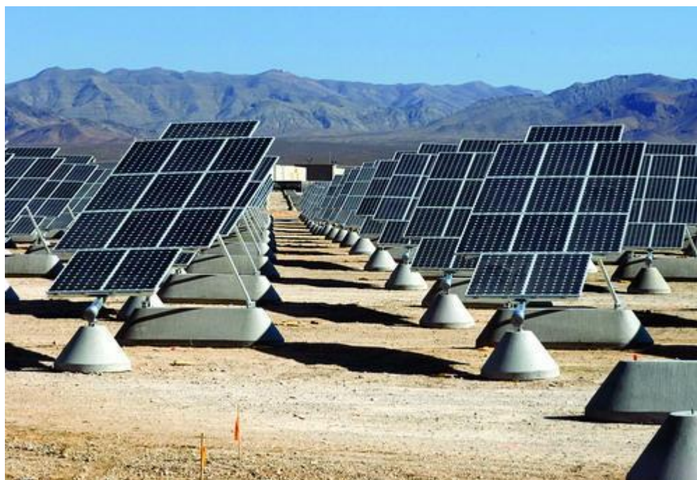
南非太阳能电池板农场

我们都知道，在 Google 简介的搜索页面背后，是大规模的数据中心作为支撑，它们每天要耗费大量的能源，并且还在不断增加。所以 Google 一直对清洁能源项目情有独钟。今天，Google 在官方博客上宣布，他们已经对位于南非的太阳能项目进行了 1200 万美元的投资。近年来，随着太阳能电池价格的大幅下降，太阳能转化成电能技术得到了广泛的应用，超过了太阳能转化热能。这个由 Intikon Energy 和 Kensani 主导的项目是正是要建设大规模的太阳能电池农场，它将有能力为 30000 个家庭提供电力。