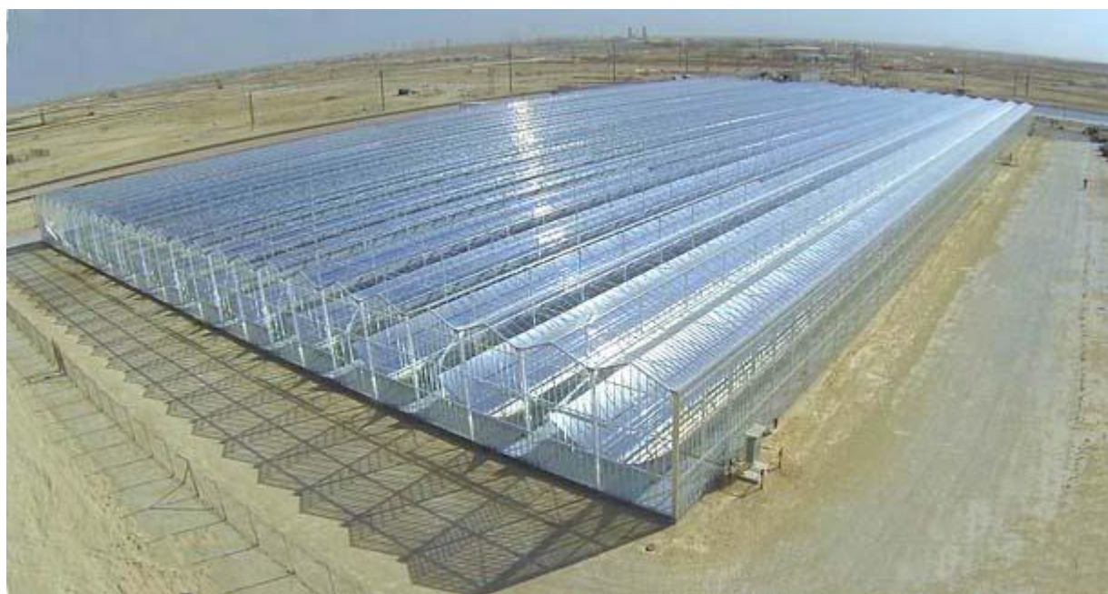
阿曼太阳能 EOR 项目

阿曼石油开发公司 PDO 和光热发电技术辅助石油萃取行业领先企业 Glasspoint 双方于 5 月 21 日联合宣布中东地区首个太阳能 EOR 项目成功投运，这个太阳能 EOR 项目日均可产出蒸汽 50 吨，通入 PDO 位于阿曼南部的 AmalWest 油田，驱动重油开采。该项目热功率 7MW，第一次试运行的测试结果表明，蒸汽产能超出预期 10%。